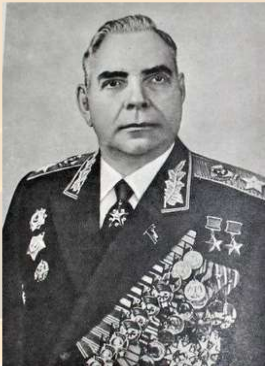
Николай Иванович Крылов

Советский военачальник, дважды Герой Советского Союза, Маршал Советского Союза.