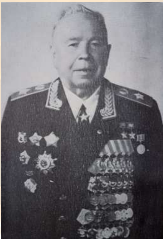
Афанасий Павлантьевич Белобородов

Белобородов, А.П. Всегда в бою /А.П. Белобородов; Литературная запись Н. С. Винокурова. — Москва: Экономика, 1984.- 352 с.-(Военные мемуары).- Текст (визуальный) : непосредственный.