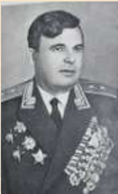
Георгий Гаврилович Семёнов

Советский военный деятель, генерал-лейтенант. Начальник штаба Воронежского военного округа и Прибалтийского военного округа.