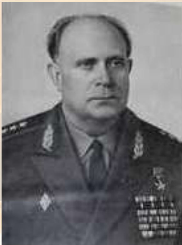
Петр Андреевич Горчаков

Горчаков, П. А. Время тревог и побед / П. А. Горчаков. - Москва : Воениздат, 1977. - 272 с. - (Военные мемуары). - Текст (визуальный) : непосредственный