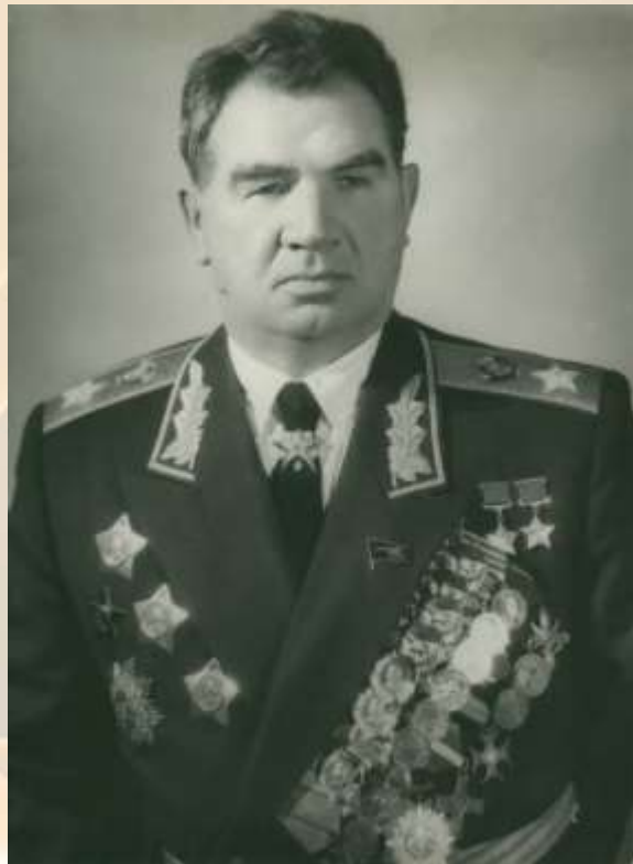
Василий Иванович Чуйков

Чуйков, В. И. От Сталинграда до Берлина / В.И. Чуйков. — Москва: Сов. Россия, 1985. — 704 с., карты. (Военные мемуары). - Текст (визуальный) : непосредственный