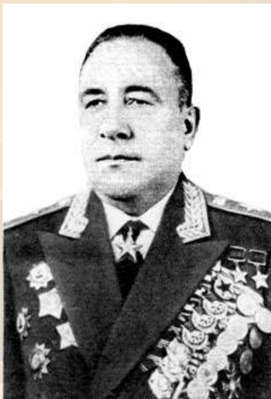
Михаил Ефимович Катуков

Советский военный деятель, маршал бронетанковых войск, дважды Герой Советского Союза