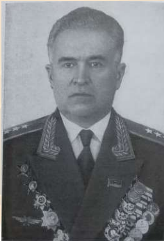
Степан Наумович Гречко

Гречко, С. Н. Решения принимались на земле /С.Н. Гречко— Москва: Воениздат, 1984. — 352 с.- (Военные мемуары). -Текст (визуальный) : непосредственный.