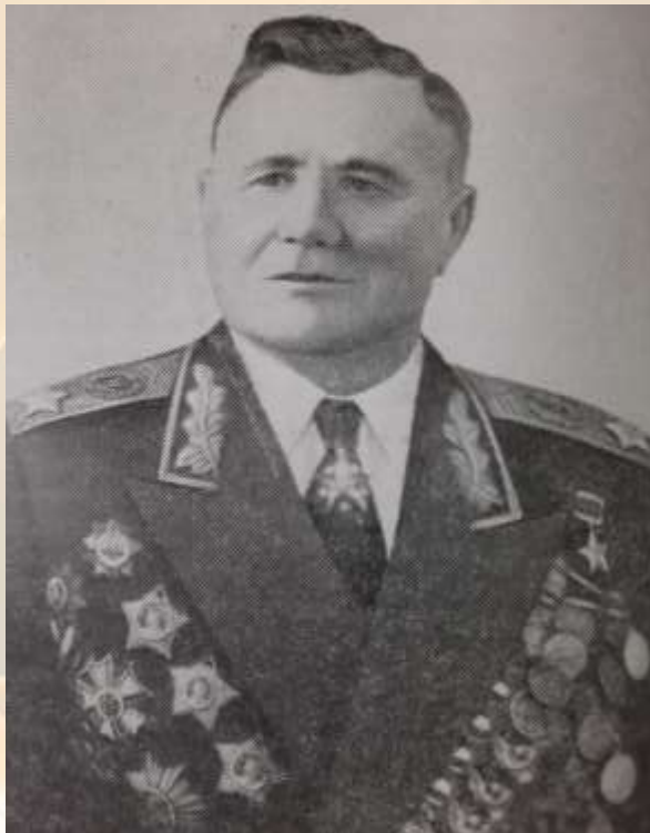
Андрей Иванович Еременко

Еременко, А. И. Годы возмездия. 1943–1945 /А.И. Еременко. — 2-е изд. — Москва: Финансы и статистика, 1985. — 424 с., ил. — (Военные мемуары). -Текст (визуальный) : непосредственный.